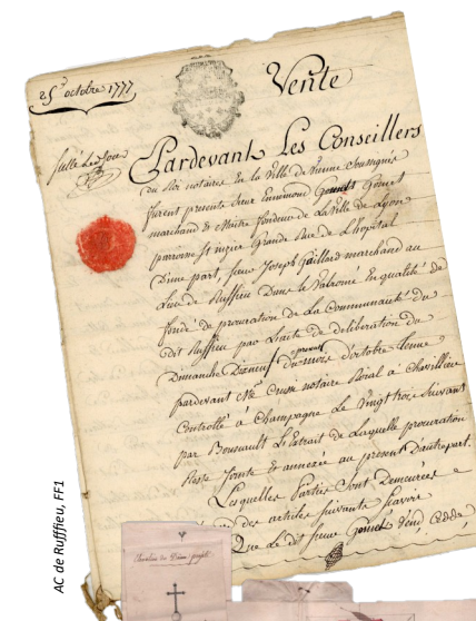
AC de Ruffieu, FFI